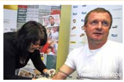
Trenér Pavel Vrba

Vstoupit do Českého národního registru dárců může každý zdravý člověk ve věku 18–35 let. „Věkové omezení jsme stanovili zejména proto, že vyšetření odebraného vzorku krve stojí kolem dvou tisíc korun a nehradí jej zdravotní pojišťovny ani stát. Musíme je získávat činností Nadace pro transplantace kostní dřeně. Proto máme zájem, aby do registru vstupovali zejména lidé mladí. S přibývajícím věkem přirozeně