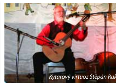
Kytarový virtuoz Štěpán Rak

Jednou z nejpůvabnějších akcí, které právě