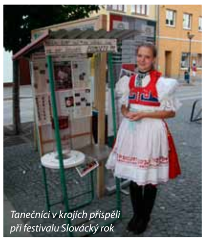
Tanečnici v krojích přispěli při festivalu Slováký rok

Druhá kasička funguje při různých příležitostech ve městě. Pravidelně se objevuje pod vánočním stromem nebo pod výšperkovanou májí na začátku května. Každý týden ji v té době pan Výleta s úředníky za přísného dohledu na policejní stanici vybírá a počítá vhozené peníze. Ty pak putují na konto